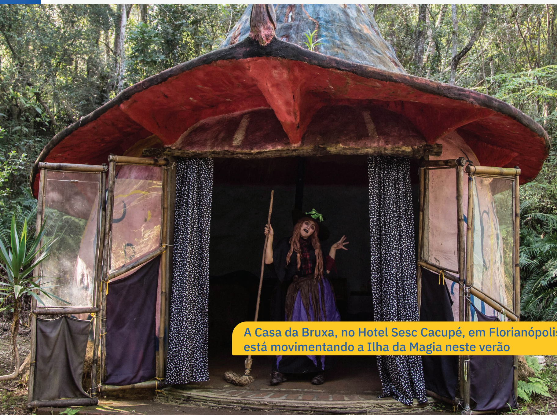
A Casa da Bruxa, no Hotel Sesc Cacupé, em Florianópolis, está movimentando a Ilha da Magia neste verão

Mais que hospedagem, os Hotéis Sesc oferecem uma experiência completa de turismo a seus hóspedes, com trilhas, áreas de recreação e uma programação intensa inspirada nas lendas folclóricas do Sul do país.