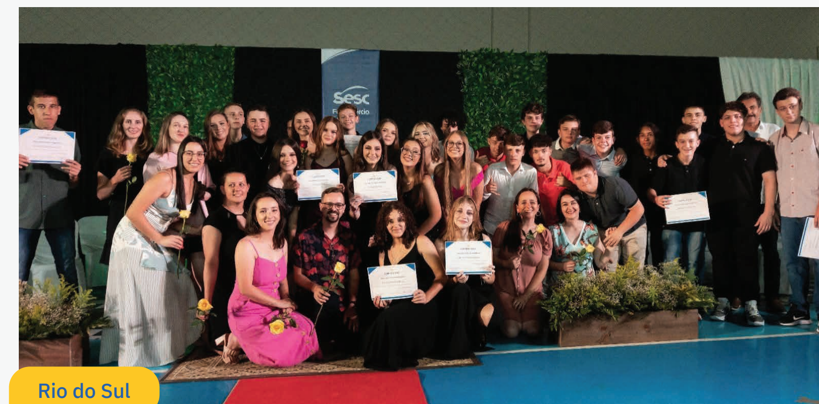
Rio do Sul