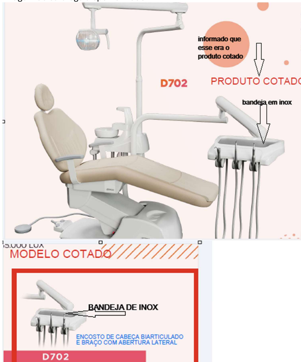
Imagem do catálogo disponibilizado:

TODAS AS IMAGENS DE EQUIPOS DO CATÁLOGO POSSUEM BANDEJA DE INOX, VEJA: